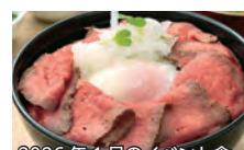
2026年1月のイベント食

自社運営だから、原価を惜しまず、美味しさと満足、そ して入居者様のご要望にお応えできます。